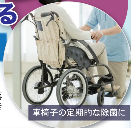
車椅子の定期的な除菌に