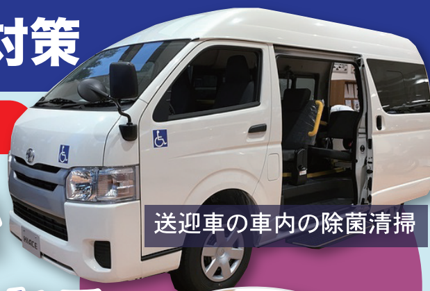
送迎車の車内の除菌清掃

「除菌液剤をスプレーして拭き取る」この一連の作業を省くことができるナノミストバスターのご紹介です。持って吹きかけるだけ！除菌作業にかかる時間をそぎ落とします。噴霧される液は極微細ナノミストのため、拭き取り作業を省くことができます。