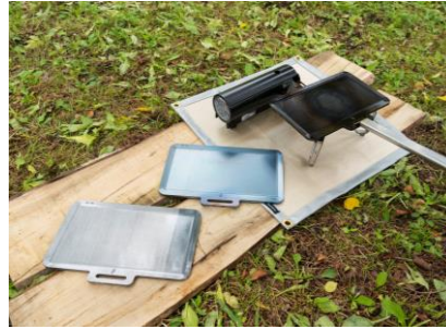
本格キャンプ用MY鉄板づくり