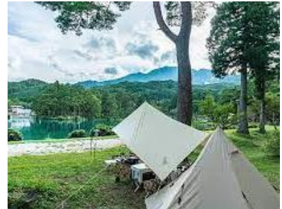
千人塚公園キャンプ場