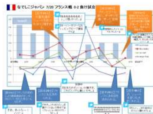
図 なでしこジャパン試合中のツイートの感情値の変遷

過去、 マッシュアップ・アワード 、 LINE Bot Awards などの大規模なプログラミングコンテストや、自社ハッカソン、Docomo 社のハッカソンで使われ、数百種類の斬新なアプリに組み込まれてきています。サッカーの試合中の感情の変遷が日経新聞に取り上げられたり、産学界で様々受賞した コトバノモリ はじめ、数百のアプリで活用されてまいりました。