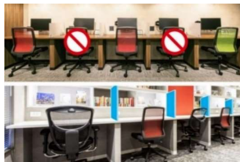
感染症対策 イメージ