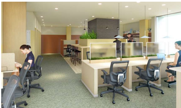
BIZcomfort 八千代緑が丘 イメージ

※新型コロナウイルス感染症(COVID-19)の影響によりオープン日などが変更となる可能性があります。