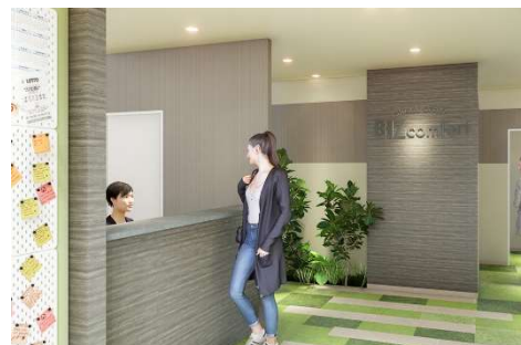
エントランス・受付 イメージ

当施設は 24 時間 365 日利用できます。ライフスタイルに合わせていつでも使えるため、フレックスタイム制のはたらき方にも便利。テレワークの他、資格取得のための勉強や副業などにも活用できます。平日はコンシェルジュもいるので、来客対応や荷物の受取・転送サービスも承ります。