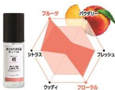
No.49 香調：ジュシーピーチの香り