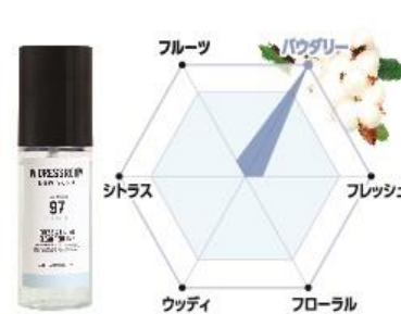
No.97 香調：洗い立てのコットンの香り