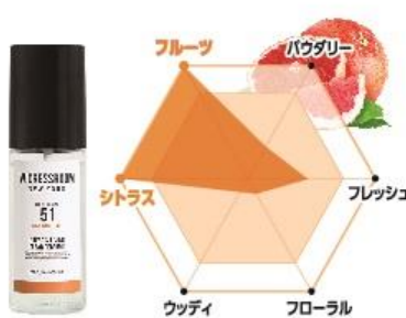
No.51 香調：フレッシュシトラスの香り