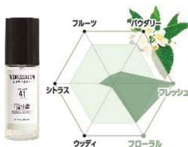
No.41 香調：大人っぽいジャスミンの香り