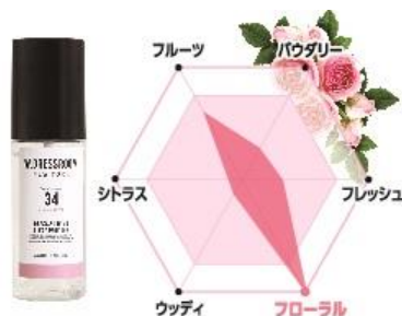
No.34 香調：はなやかなフローラルの香り