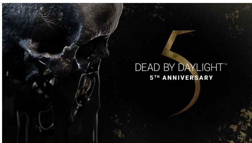
Dead by Daylight（デッドバイデイライト）アナウンストレーラー

株式会社 3goo（サングー）（本社：東京都渋谷区、代表取締役：ディ・コスタンゾ・ニコラ）は本日 9 月 24 日、全世界 3600 万人を震撼させるホラーサバイバルゲーム『Dead by Daylight』の 5 周年を記念した新パッケージ製品『Dead by Daylight 5th アニバーサリー エディション 公式日本版』を PlayStation®4、PlayStation®5 に加えて、NintendoSwitch™で、11 月 25 日に発売することを発表しました。本製品は、全世界から賞賛を受けるサバイバルホラーシリーズの金字塔「バイオハザード」コラボチャプターなどを収録した、5 周年にふさわしい特別なパッケージとなっています。