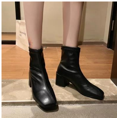
【2位】 ショートブーツ