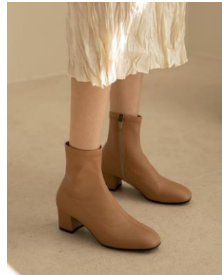
【3位】 [pinkelephant] ストレッチ アンクルブーツ

スエード調とレザー調から生地を選択できる。柔らかい素材とふかふかのインソールで履き心地も抜群。