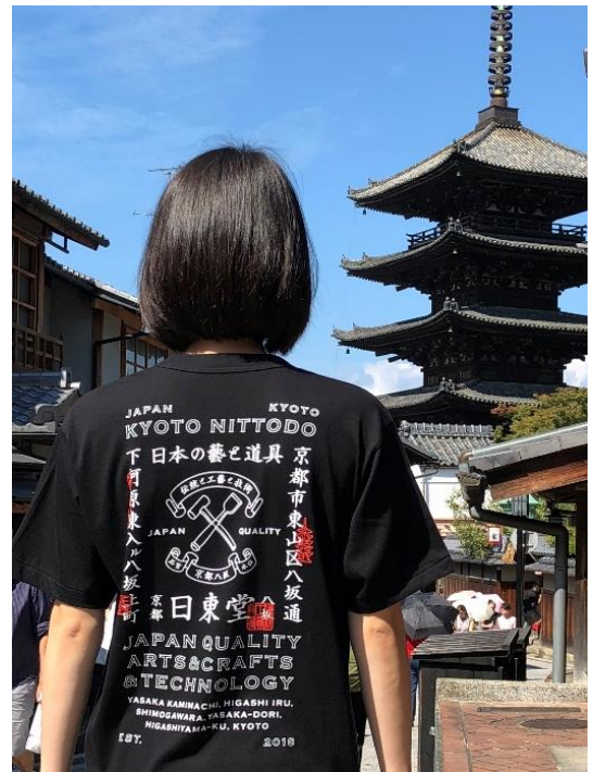
日東堂 T シャツ

お客様や従業員の安全確保のため、新型コロナウイルス感染症拡大による緊急事態宣言発令中は、日東堂は臨時休業しています。その間も引き続きSNSで情報発信をしたり、来日できないお客様にも日東堂を体感いただけるよう中国で期間限定の売場展開をおこないました。営業再開後はより心に残る接客、品揃え、空間づくりに尽力し、『日東堂』があるからまた京都に行こう」と思っただけの店舗となることを目指します。株式会社ニトムズは、今後も『日東堂』を通して、多くの人々とメイド・イン・ジャパンの真髄を共有していきます。