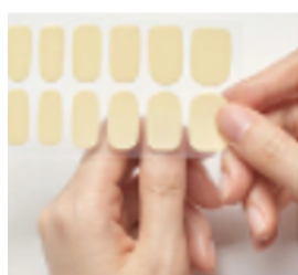
①シールサイズを選ぶ