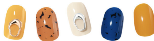
BEIGE STONE P02