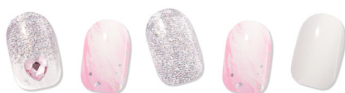
Hearty Pink P06