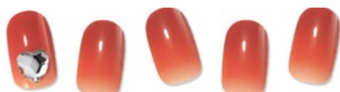
Heart On You P04