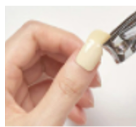
③爪の形に合わせてカット