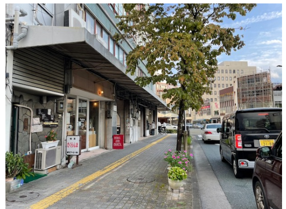
KAGIYAビル 〒430-0944 静岡県浜松市中区田町229-13 TRANSPORT 浜松駅から徒歩8分

Sobagniは、1935年（昭和10年）8月1日に創立した共和レザー株式会社から立ち上がったブランドです。Sobagniでは今話題のSDGsを目指し、人にも、地球にも優しく、アニマルフリーな素材でもある「エシカルレザー」を使用し様々な商品をみなさまにお届けしてまいります。