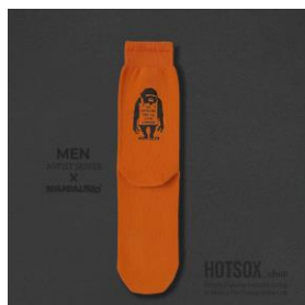
MEN | ¥1,980 WOMEN | ¥1,430