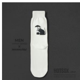
MEN | ¥1,980 WOMEN | ¥1,430