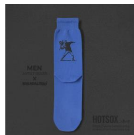
MEN | ¥1,980 WOMEN | ¥1,430