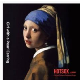
真珠の耳飾りの少女 WOMEN | 21.0-26.0cm ¥1,430