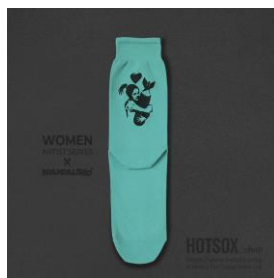
WOMEN | ¥1,430