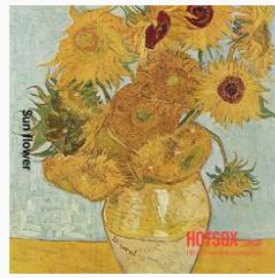
ひまわり WOMEN | 21.0-26.0cm ¥1,430