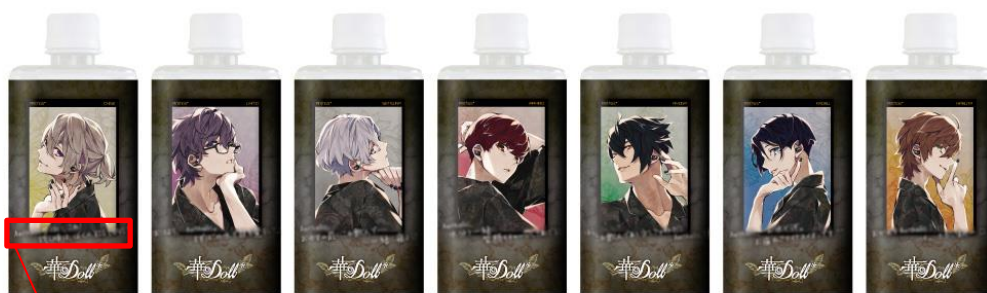
ミネラルウォーター