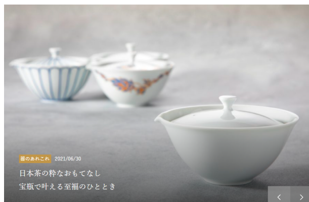
【Tealife magazine】日本茶の粋なおもてなし 宝瓶で叶える至福のひとつ

日本茶づくり、器職人のこと、新スタイルのお茶の楽しみ方など、様々な日本茶時間をご提案。「Tea LOVER」では、各界の方々に、お茶にまつわるあれこれや、日本茶時間の過ごし方などをインタビュー。