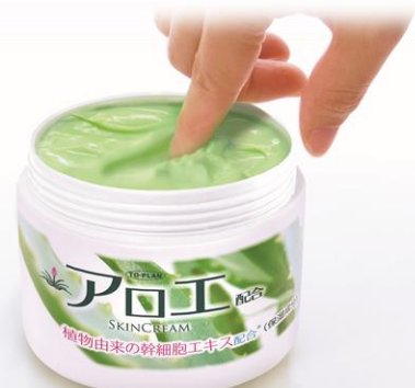
リニューアルした『アロエ配合スキンクリーム 220g』

TO-PLAN「アロエ配合スキンクリーム」は、1996 年発売以来、累計 2,000 万個売れている当社のロングセラー商品です。クリーム保湿成分は、アロエエキスはじめ、ヒアルロン酸、グリセリン、コラーゲン、スクワラン等を配合した、肌にやさしいみずみずしい感触のクリームです。使い心地はサラツとしてべたつかず、肌の潤いを保ち、乾燥から守ります。保湿効果が高く、少量で良く伸び、肘やひざなどにもお使いいただけます。また、化粧下地やナイトクリーム、男性のひげ剃り後のお手入れにもお使いいただけます。TO-PLAN「アロエ配合スキンクリーム」は特に乾燥が気になる秋冬になると、家族全員で使用していただく看板商品で、親子 3 代でお使いいただいているロングセラー商品です。