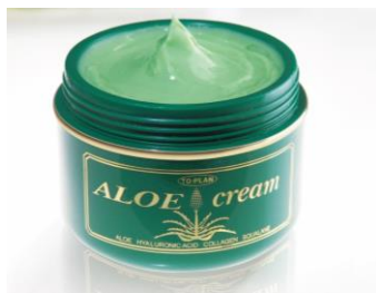
（従来品）『アロエクリーム 170g』パッケージ

日用雑貨・化粧品の企画販売を行う株式会社東京企画販売（本社：東京都小平市、代表取締役社長：江森 大佑）は、1996 年発売以来累計 2,000 万個売れたロングセラー商品 TO-PLAN「アロエ配合スキンクリーム」が 25 年ぶりに商品をリニューアルし 2021 年 10 月 1 日に販売を開始します。