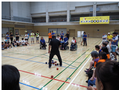
▲ボッチャ武蔵野カップ2019写真

「ボッチャの聖地」を目指す武蔵野市は、障害者スポーツの「する・みる・支える」活動の一環として、市民が参加するボッチャ競技会を開催します。そして支える活動として「日本ボッチャ協会公認サポーター」資格を取得できる講習会も開催します。