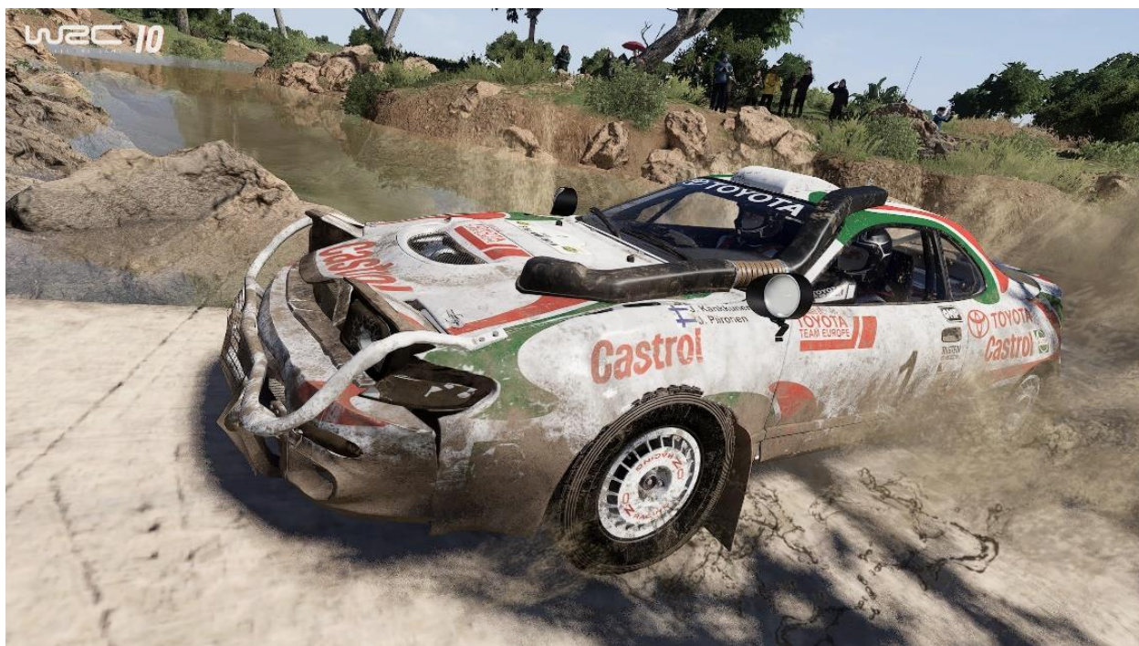
『WRC10 FIA 世界ラリー選手権』ペイントエディタ トレーラー

あわせて、「ペイントエディタ」の流れを解説する新規トレーラーを公開いたしました。