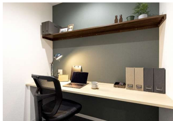
個室イメージ※装飾小物は付いてきません

新型コロナウイルス（COVID-19）の影響により、シェアオフィスを活用したテレワークの導入や、オフィス分散のためのサテライトオフィスの設置、オフィスを縮小・移転する企業が増加しています。一方で、「シェアオフィスの使い勝手がわからない」「そもそもどんな風に使うのかイメージが湧かない」といった不安の声や、ハードルが高いと感じている企業も多く見受けられます。