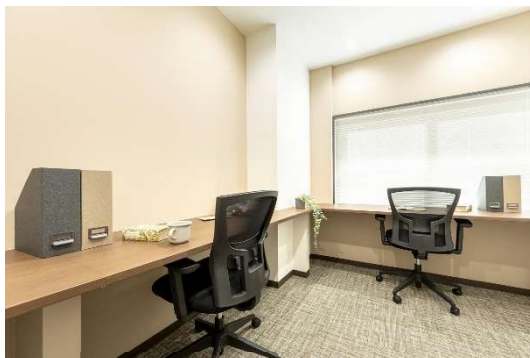
2 名用レンタルオフィス イメージ

通常のオフィスを借りると保証金や敷金がかかりますが、当施設のレンタルオフィスでは一切不要。個人事業主やテレワークの方におすすめの 1 名用の他、スタートアップやサテライトオフィスにぴったりの 2～7 名用を用意しました。デスク・チェアやインターネット環境を完備しているため、パソコンひとつですぐに使えるのも魅力です。※別途契約金が必要です。