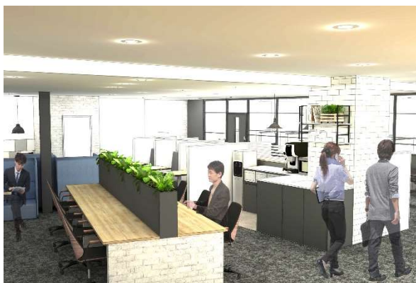
自由に使えるラウンジ・コワーキングスペース

レンタルオフィス・コワーキングスペース事業を行う株式会社 WOOC（読み方：ワーク 所在地：東京都品川区、代表取締役：阪谷 泰之）は、2021 年 10 月 25 日オープンしたシェアオフィス「BIZcomfort（ビズコンフォート）水戸」にて、 レンタルオフィス無料体験モニターを、5 室限定で募集いたします。