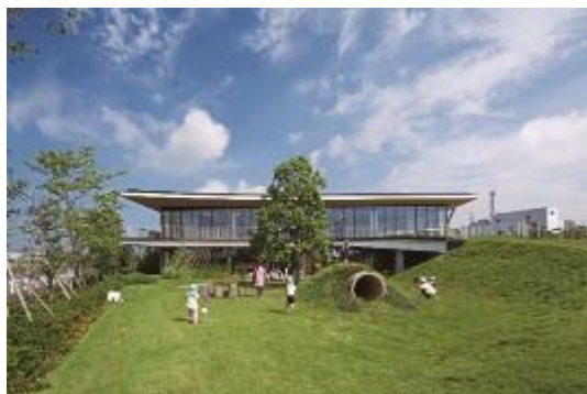
保育・児童施設「ふくろうの森」外観

※現在は新型コロナウイルス感染症拡大への影響に配慮し、対面での実験教室は休止しております。