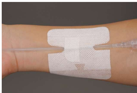
上下から両面テープで挟む『ミゼアセーフ W』使用イメージ

今回発売する2品はそれぞれ独自の形状を有しています。『ミゼアセーフ X』はクロスする形状で、固定力をアップして抜去リスクを軽減します。『ミゼアセーフ W』は2枚のシートがチューブを上下から挟み込む形状で、多種多様なチューブ類をしっかりと固定できます。いずれもチューブ類の固定部位に使用することで、抜去抑止力を発揮します。さらに、通気性を高めた独自の粘着技術を用いた、かぶれにくい設計です。