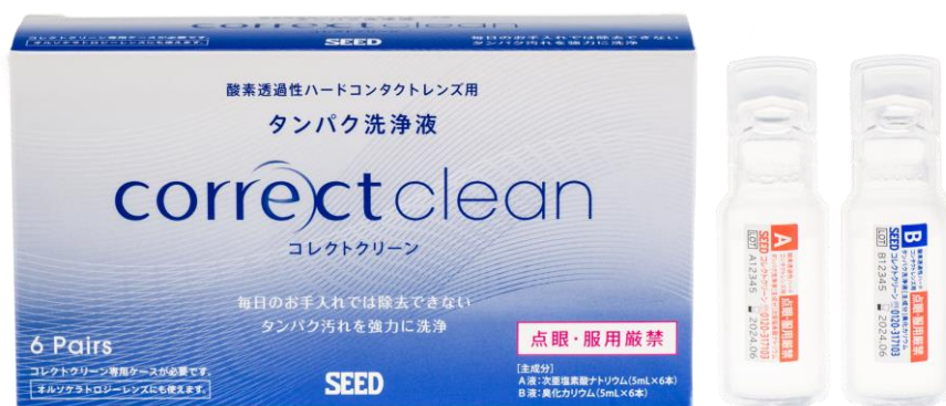
コレクトクリーン

コンタクトレンズの製造販売を行う株式会社シード（本社：東京都文京区、代表取締役社長：浦壁 昌広、東証 1 部：7743）は、毎日のお手入れでは除去しきれないタンパク汚れを分解・除去する酸素透過性ハードコンタクトレンズ用タンパク洗浄液「コレクトクリーン」を 11 月 8 日（月）より発売いたします。