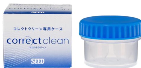
コレクトクリーン専用レンズケース* 2

* 2 「コレクトクリーン」を使用する際は「コレクトクリーン専用ケース」を使用する必要があります。