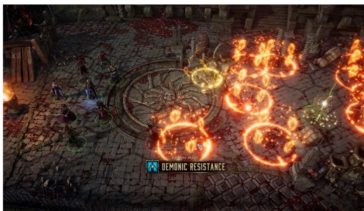
※画面は開発中の海外版

ディサイプルス リベレーション 2021 年 11 月 25 日発売 プレオーダー PlayStation™Store https://bit.ly/3wrHp4G