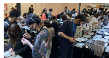
東洋ルース販売会会場の様子