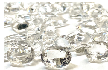
300種類目の宝石ポルーサイト