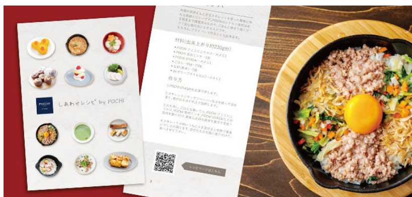
レシピブックの表紙 (左写真) とページ例 (右写真)