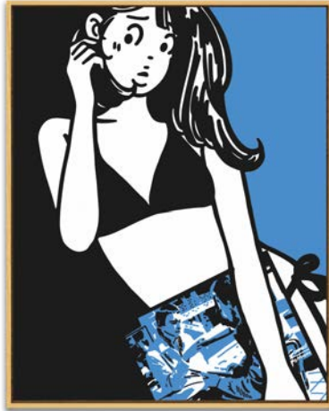
“Hip & Square” ©saakurai hajime

今回、3年半ぶりとなる大阪個展“Hip & Square”は、さくらいが表現のモットーとしている「スクエアな探求とヒップなパフォーマンス」を軸に、愛する音楽とアートを掛け合わせる原点回帰のテーマを基調とし、本展描き下ろしとなるF50の新作をメインに大型作品にも挑戦します。楽しくてワクワク満載のさくらはじめワールドをお楽しみください！