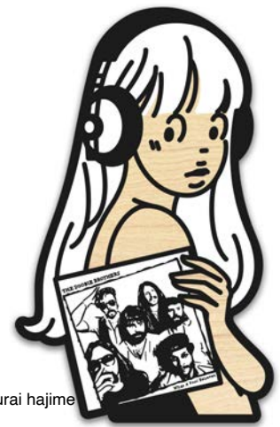
“Hip & Square” ©saakurai hajime

また、キャッチーでファッショナブルな作風でコミッションワークの依頼も多く、大型ファッション商業施設、音楽フェス、ファッションブランド、食品パッケージや、公私ともに親しいミュージシャン NONA REEVESのアルバムジャケットなど幅広い分野で活躍をしています。