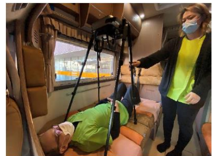
移動型訪問診察カー