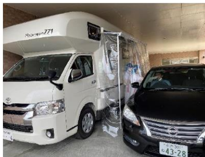
ドライブスルー型 PCR検査施設