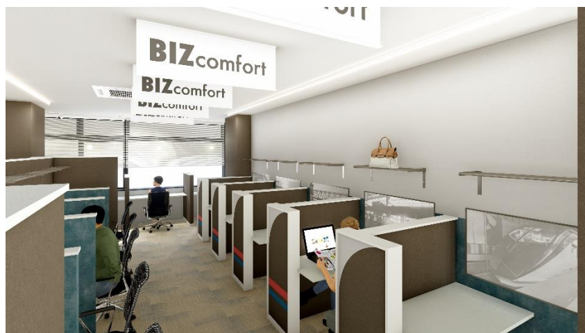
KEISEI×BIZcomfort 青砥駅前 イメージ

※新型コロナウイルス感染症(COVID-19)の影響によりオープン日などが変更となる可能性があります。