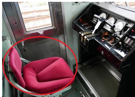
京成 3600 形運転士席 イメージ

オフィスチェアで快適なワークブース、通話や WEB 会議専用の個室のテレフォンブース等、テレワークやフリーランスの仕事場の他、自習や勉強にも快適なスペースを提供します。