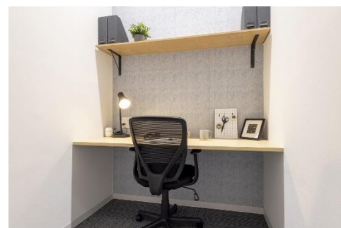
個室 固定席 イメージ