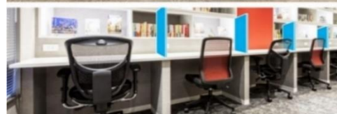
感染症対策 イメージ