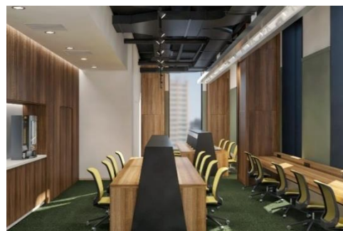
カフェブース イメージ