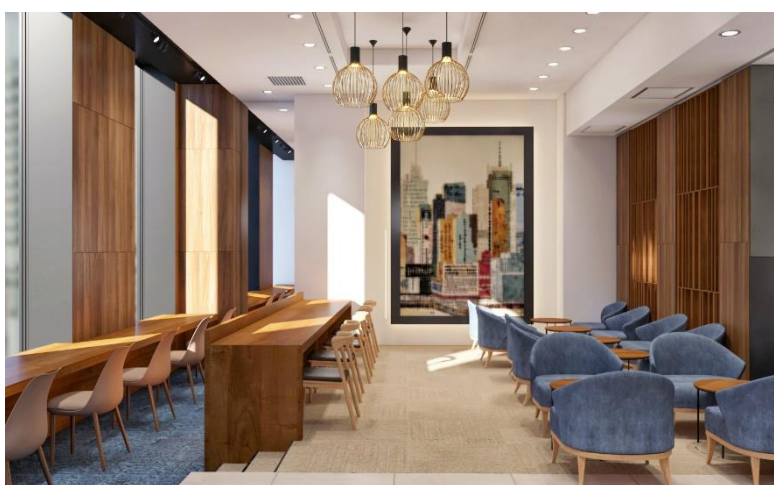
BIZcomfort ザ ロイヤルパークホテル アイコニック 東京汐留 イメージ

※新型コロナウイルス感染症 (COVID-19) の影響によりオープン日などが変更となる可能性があります。