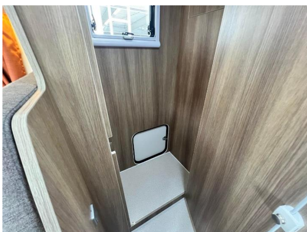
様々な用途に使えるマルチルーム例