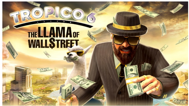
DLC ラマ・オブ・ウォールストリート