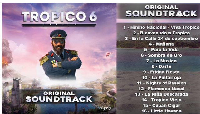
オリジナルサウンドトラック