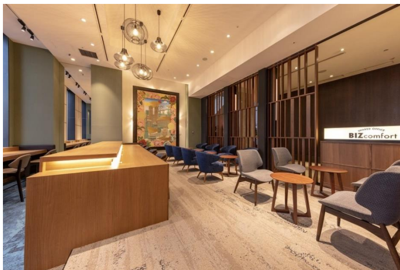
BIZcomfort ザ ロイヤルパークホテル アイコニック 東京汐留

※新型コロナウイルス感染症(COVID-19)の影響によりオープン日などが変更となる可能性があります。