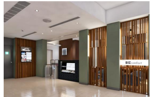
施設入口 イメージ