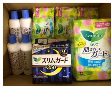
女性に配慮した備蓄品の準備