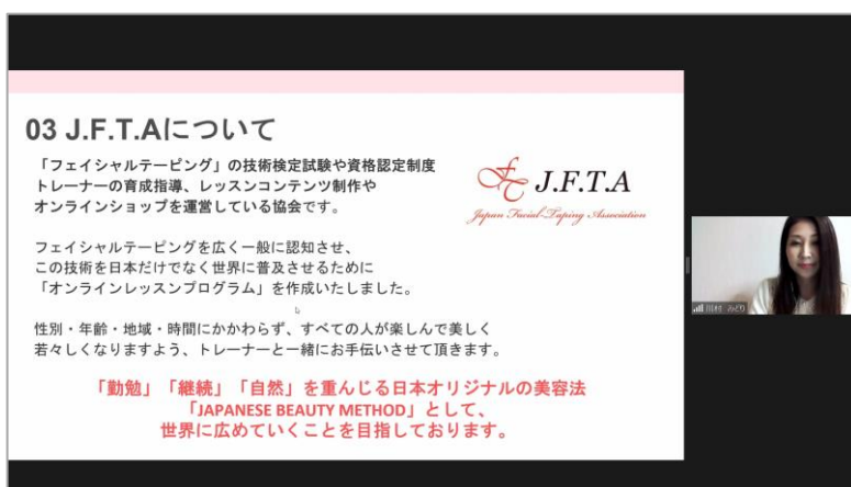
オンラインセミナーの様子

「フェイシャルテーピング」はテープを正しく貼ることが大切です。その技術を丁寧にお伝えするためには専門トレーナーによるオンラインでのパーソナルレッスンサービスが必要であり、今回初開催となったセミナーは、その第一歩となる“顔の筋トレ”「フェイシャルテーピング」の理論や実績を多くの方に知っていただきたいという思いからスタートしました。