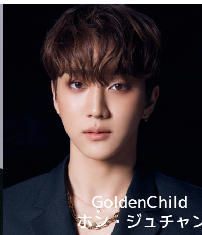
GoldenChild ホン・ジュチャン