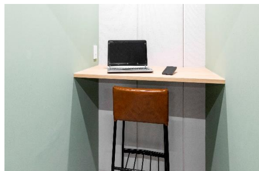
テレフォンブース イメージ

食事や WEB 会議のできるカフェブース、静かに集中できるサイレントブース、通話・WEB 会議専用のテレフォンブースを、用途に合わせて選べます。各席はソロワーク用の間仕切りがついた席がほとんどなので、周りを気にせず集中できます。また、無料のプリンターやフリードリンクもあるので、1 日中オフィスに居ても快適に過ごせます。