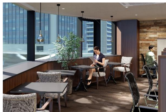
BIZcomfort 松屋町 イメージ (2)

コンセプトは「子供心を思い出させる、ワクワクするシェアオフィス」。松屋町らしい、古き良き雰囲気イメージして、アンティーク調の内装に仕上がっています。コンパクトな広さでありながらも、複数のタイプの席を設け、“今日はどの席にしようかな？”と選んでいただけるようにしました。半個室型の籠れる秘密基地のような席もあります。