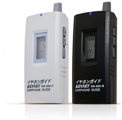
イヤホンガイド KR-500 送信機（左）受信機（右）