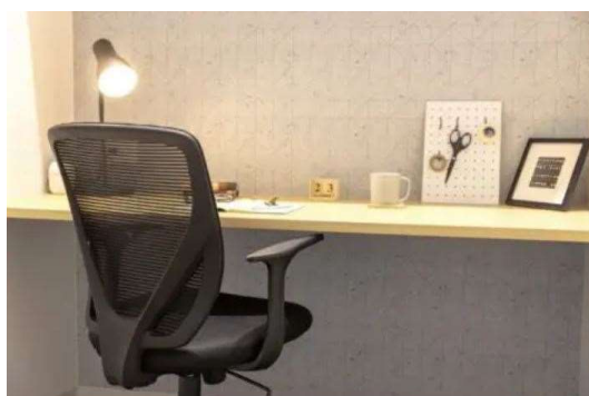
契約者専用の固定席 イメージ