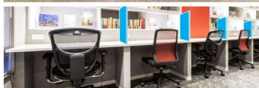
感染症対策 イメージ