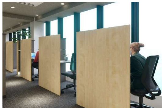
カフェブース イメージ