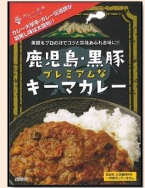
↑ 新たに加わったカレー