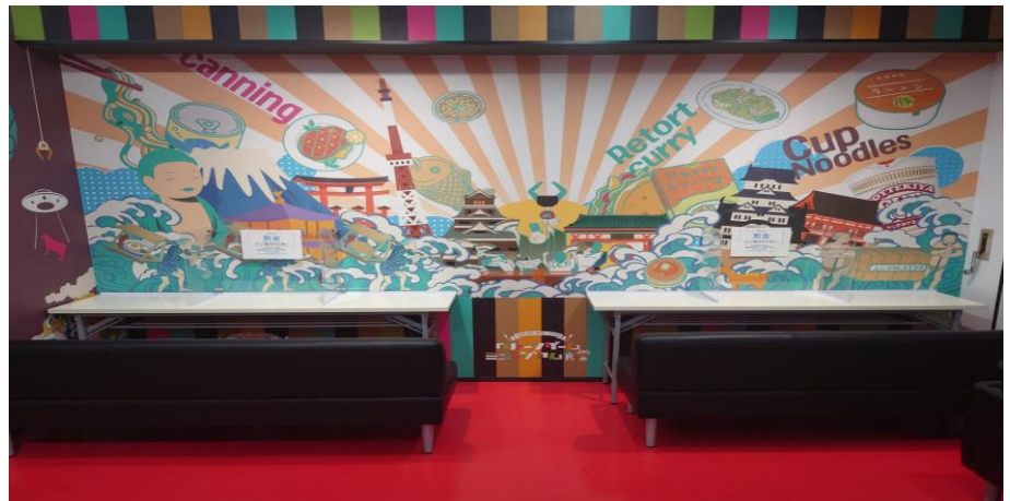
↑ 2021年7月から登場した、エブリデイとってき屋東京本店のクレーンゲーム食堂コーナーの写真