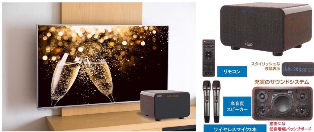
アンプ内蔵カラオケサウンドスピーカー サウンドプロ MAX イメージ