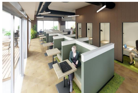
カフェース イメージ

元ホステルのカフェ・バーだった開放的な間取りを生かし「アウトドア」をコンセプトとした緑を基調としたデザインに。天気の良い日には、オープンテラス席を利用して、仕事や食事を楽しむことができるなど、気軽に気分転換を図ることができます。