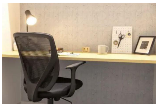
レンタルオフィス イメージ

コワーキングスペース内は、食事や WEB 会議のできるカフェブース、通話・WEB 会議専用のテレフォンブースの他、自分専用席を確保できる固定席（別途契約が必要）など、用途に合わせてブースを選べます。さらに、無料のプリンターやフリードリンクもあるので、1 日中コワーキングスペースに居ても快適に過ごせます。