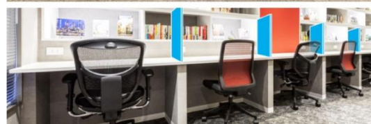
感染症対策 イメージ