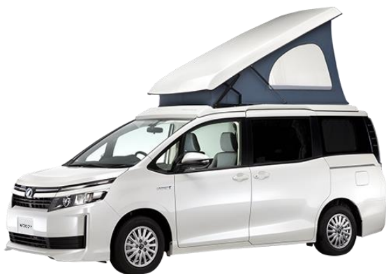
[ 6 位] ヴォクシー DAYS POP（ホワイトハウス）

どちらもキャブコンなどの贅沢装備まではいきませんが、キャンピングカーに求められる「乗る」「寝る」「積む」が可能です。