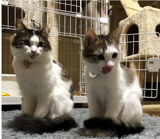
↑過去、保護猫の里親になった経験のある 宮原店 早川綾子店長 ↑早川店長が里親になった2匹の猫