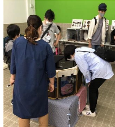
↑過去の保護猫譲渡会の様子

当社のエブリデイゴールドラッシュでは、リユースを利用する方の『不用』を『必要』に変え、世界中の人たちの笑顔を作るをモットーに、前の持ち主の想いを大切に、次の新しい持ち主の方へ商品を繋ぐ仕事をしております。