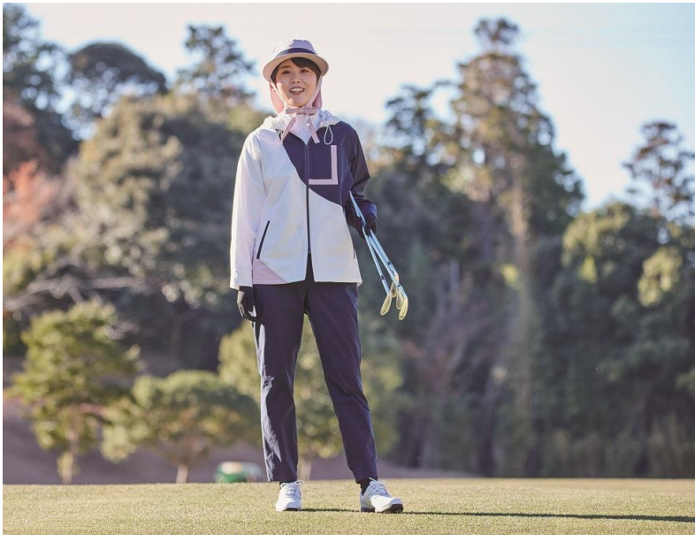
「SPORTY + POP MIX」：軽やかさや明るさ、爽やかさでエレガントなカラーリング。デザインと機能を両立させたスマートな装いに。