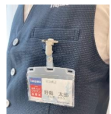
新型コロナウイルスワクチン接種済みシール