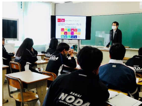
（写真上：登壇者・リーブ 21、春日井）