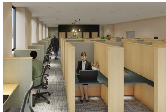
2F ワークブースイメージ