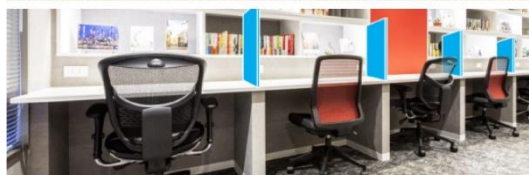
感染症対策 イメージ