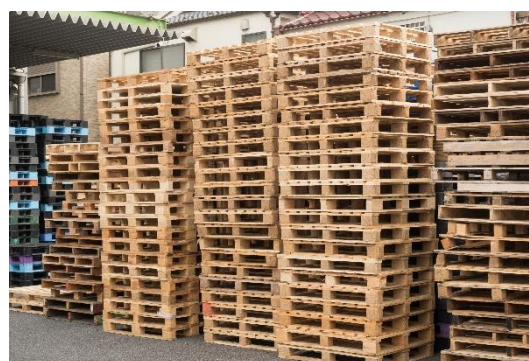
廃パレット イメージ