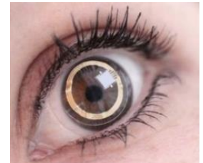
センサー装着イメージ