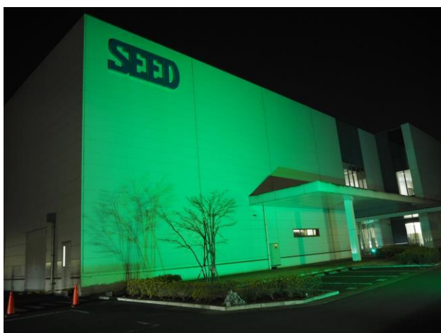
ライトアップの様子：シード鴻巣研究所 2号棟エントランス

コンタクトレンズの製造販売を行う株式会社シード（本社：東京都文京区、代表取締役社長：浦壁 昌広、東証1部：7743）は、世界緑内障週間である2022年3月6日（日）～3月12日（土）に合わせた「ライトアップ in グリーン運動」に協力するため、シード鴻巣研究所（埼玉県鴻巣市）を本運動のシンボルカラーである“グリーン”にライトアップいたします。