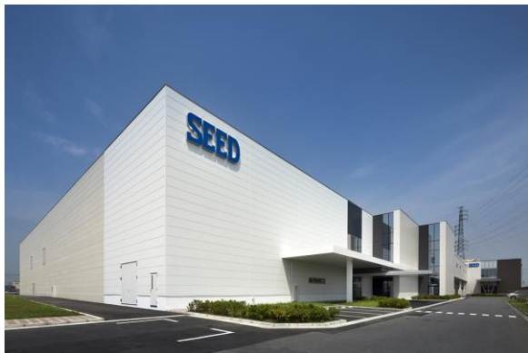
シード鴻巣研究所 2号棟外観

現在では、近視・遠視用に加えて、遠近両用や乱視用等の高機能・高付加価値を備えたレンズも取り揃え、日本国内のみならず、海外進出も積極展開しております。