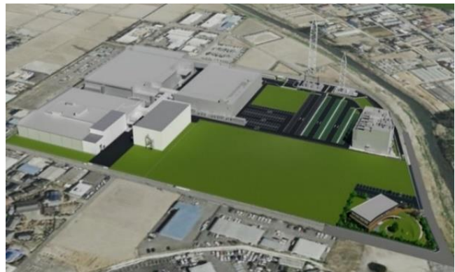
鴻巣研究所全体の鳥瞰図