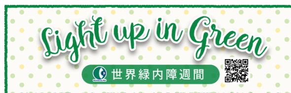
「ライトアップ in グリーン運動」バナー画像

緑内障は、40歳以上の20人に1人の割合で発症している *1 と言われており、我が国における中途失明原因の第1位となっております。一方で、近年の緑内障の診断技術や治療法の進歩により、早期に発見し治療を継続すれば緑内障により失明に至る可能性は大幅に減少します。そのため緑内障をよく知ること、自覚症状が無くても定期的に眼科を受診することが大切です。