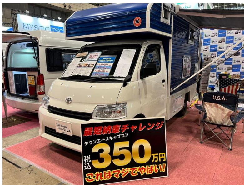
Stage21「リゾートデュオ バンビーノ ファミリア L.A」

関連記事： https://japan-crc.com/ccn/news/jccs2022-0210ys/