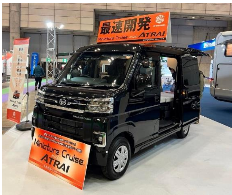
岡モーターズ「ミニチュアクルーズ」