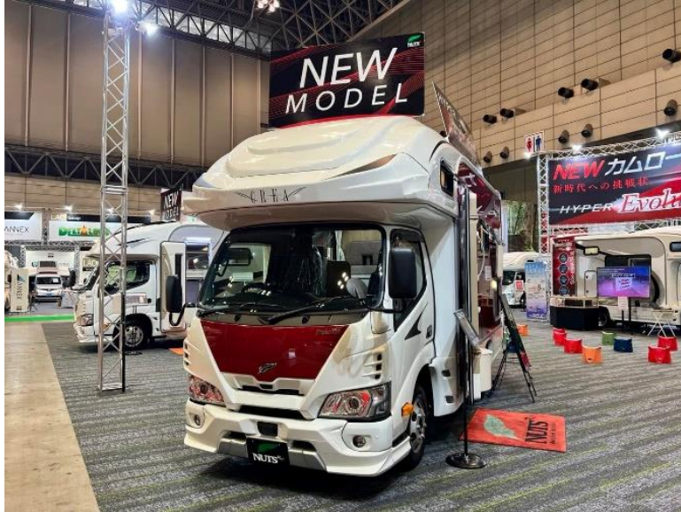
ナッツ RV 「クレア ハイパーエボリューション NEO」

国内キャンピングカービルダーのほとんどがキャブコンのベース車両とする車がモデルチェンジしました。