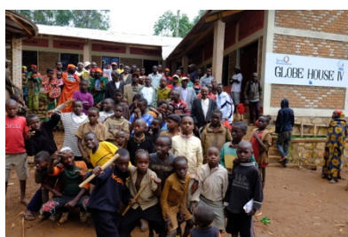
2017 年 ブルンジ共和国 globe ハウスⅣ