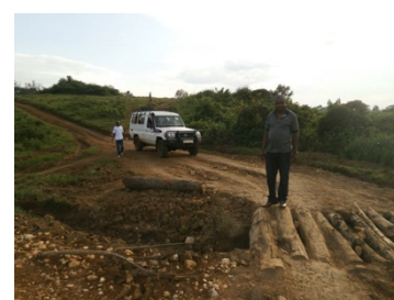
2016 年 コンゴ民主共和国 globe ロード