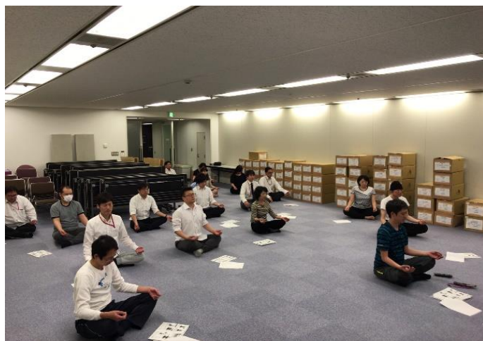
（上写真：ヨガや瞑想を実施）