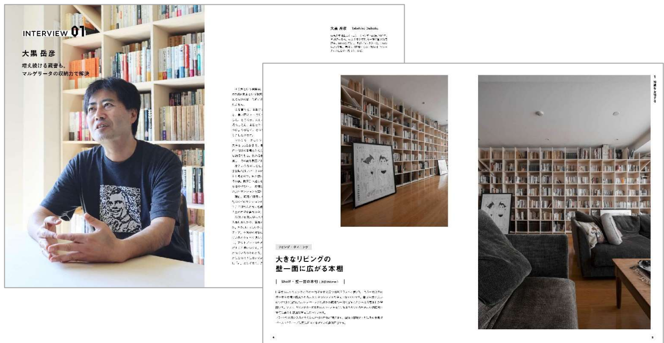
24 の事例を掲載した事例集「at sight」